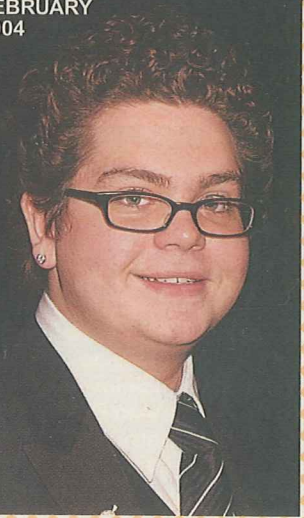
AUGUST 23, 2004 IN TOUCH 51