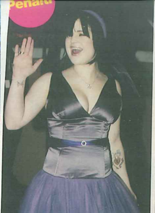
KELLY OSBOURNE Este es el momento en el que debes usar o no usar maquillaje si quieres hacer una buena impresión.

"Con [sólo] una pastilla, era como si alguien apagará el switch de sentirme mal. Me siento bien otra vez". Ozzy Osbourne , hablando sobre su tumor recientemente detectado.