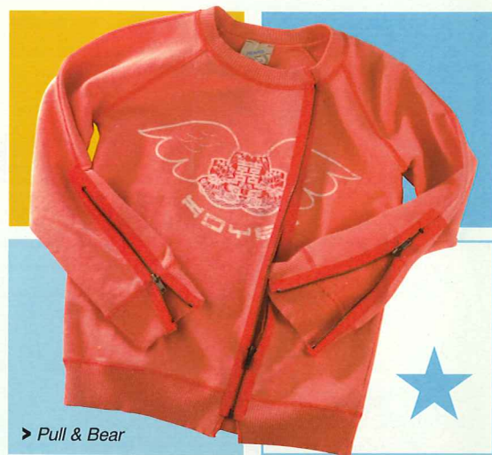
> Pull & Bear