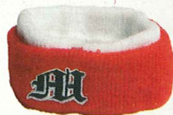
• Muñequera deportiva con bordado, A+A.